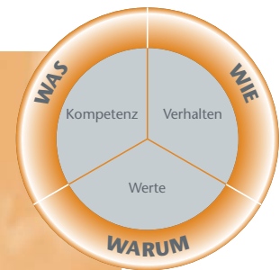
Das INSIGHTS MDI®/ ASSESS by Scheelen® Kompetenz-Modell

Computergestützt bieten die Diagnosetools kosteneffizient und zeitnah zuverlässige Informationen über Kompetenzen, Verhalten und Werte für Ihre gezielte Personalauswahl und Personalentwicklung.